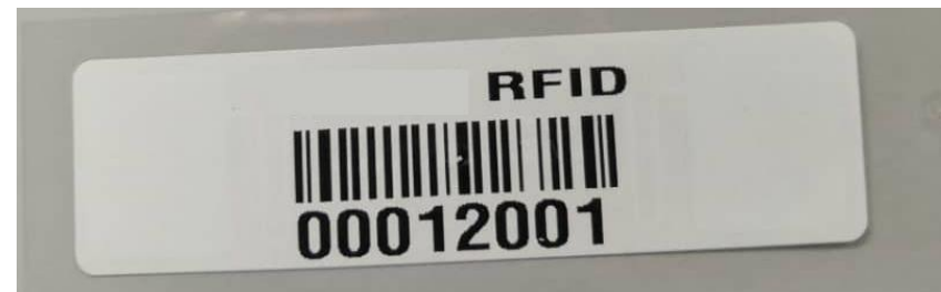
CONTOH : TAG RFID

PERHATIAN !!!! ** PASTIKAN GRADUAN BERATUR MENGIKUT NOMBOR GILIRAN PADA SLIP