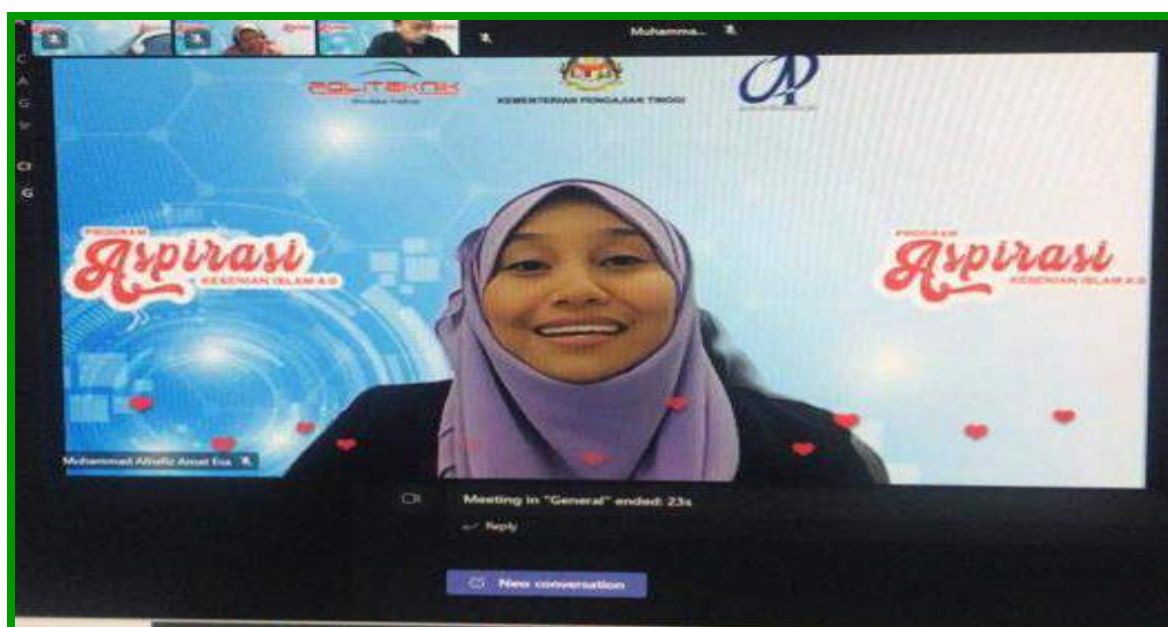
Ucapan Ketua Jabatan Pengajian AM